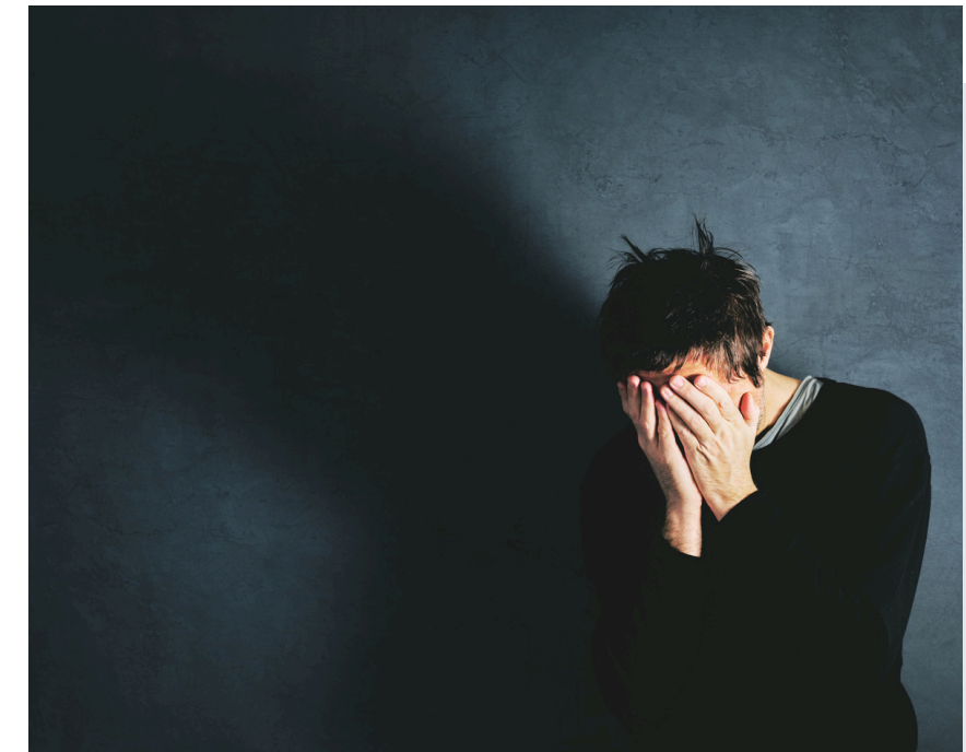
le deuil du connu

Mais c'est là que tout commence : dans ce vide entre ce qui n'est plus et ce qui n'est pas encore.