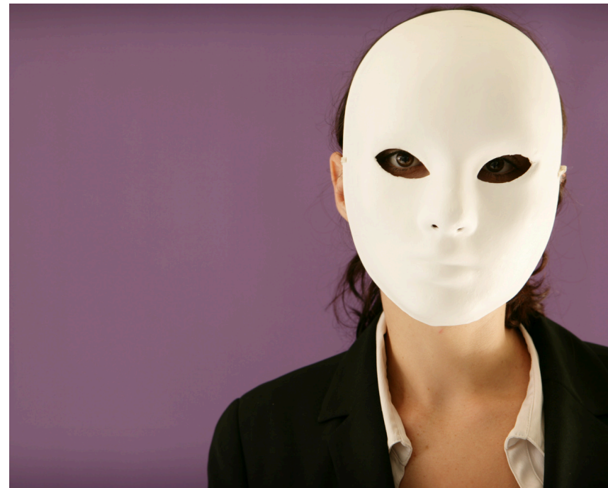
le deuil identitaire