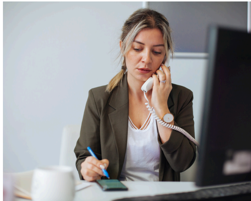
Le deuil d'un poste, d'un statut.